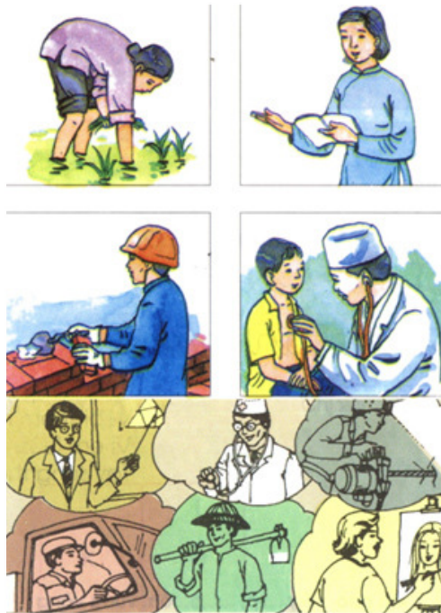
Một số bức tranh minh họa nghề nghiệp của các nhân vật trong sách giáo khoa Tiếng Việt lớp 1-5,

Thông qua thực hành trong gia đình, các bài học trong sách giáo khoa, cũng như những quảng cáo trên các phương tiện truyền thông đại chúng... các khuôn mẫu giới sẽ “thấm” dần vào các bé. Điều này dẫn đến hậu quả là khi trưởng thành, sẽ không ai nhận ra mình đang bị sống và làm việc dựa trên định kiến giới. Đó là lý do vì sao bất bình đẳng khó xóa bỏ dù đã có nhiều chương trình truyền thông được thực hiện. Do vậy, điều cần thiết là chỉ ra cho các em những điều bất hợp lý ấy và quan trọng hơn là cho các em thấy những hình mẫu khác, những nếp sinh hoạt khác với xưa.