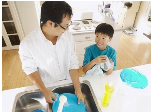
Đàn ông rửa bát thì sao?

Hiện nay, không ít người vẫn đang cho rằng sự phân công công việc như xưa là bình đẳng, bởi mỗi người, mỗi việc đàn ông đã “xây nhà” thì đàn bà cần “xây tổ ấm”. Bàn về vấn đề này, các bạn công nhân khu công nghiệp Phú Thị có nhiều ý kiến trái chiều nhau, nhưng nhiều ý kiến vẫn đang nghiêng theo hướng: “Đàn ông xây nhà, đàn bà xây tổ ấm”, điều này có thực sự hợp lý?