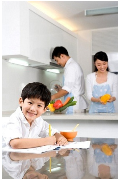
Làm việc nhà cùng nhau sẽ giúp các thành viên trong gia đình gần gũi hơn

Trong câu chuyện của Thảo và Hưng, Thảo không một lời kêu ca khi chăm sóc cho người yêu. Nhưng khi được hỏi về cảm nhận của mình, Thảo chia sẻ: “Tại vì bà mình, mẹ mình vẫn làm việc nhà từ trước đến nay nên nếu không làm, mình sợ bị đánh giá là không đảm đang. Nhưng nói thật, mình thấy mệt mỏi vô cùng, cả mình và người yêu đều chỉ được nghỉ một ngày chủ nhật. Ở bên người yêu cũng thấy hạnh phúc, nhưng bây giờ mình lại thấy sợ cuối tuần vì đến lúc đó mình chẳng được nghỉ ngơi gì cả, công việc có khi còn bận hơn cả đi làm”.