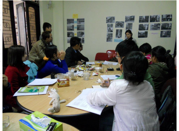
PhotoVoice đã đem đến sự hào hứng cho các thành viên tham gia.

Với tiến trình công nghiệp hóa, công nhân tại các khu công nghiệp đang ngày càng trở nên một lực lượng quan trọng trong xã hội. Trong khi những vấn đề pháp lý như hợp đồng lao động, bảo hiểm... của nhóm này đã nhận được sự quan tâm của công luận, các vấn đề liên quan đến đời sống xã hội, tinh thần và sức khỏe thể chất của họ vẫn còn bị bỏ ngỏ. Không chỉ thế, những nhu cầu bình thường và thiết yếu về tình yêu, tình dục và sinh sản của những chàng trai, cô gái đang “tuổi yêu” này còn bị nhìn nhận một cách tiêu cực. Đâu đó, những vấn đề của họ đã được báo chí nhắc đến, nhưng vì phản ánh với con mắt của người ngoài cuộc, hầu hết các bài báo chưa thấy được các yếu tố môi trường, xã hội tác động đến vấn đề của người công nhân và do vậy thường mang tính đổ lỗi. Điều này đã làm các định kiến với người công nhân, nhất là nữ công nhân, vốn đã nặng nề lại càng nặng nề hơn.